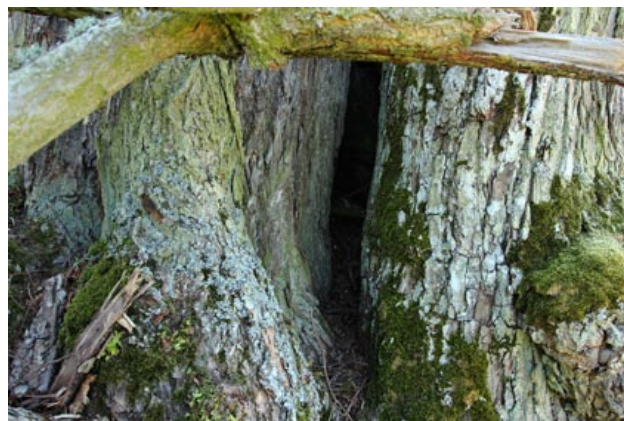
Obr. 6. Lánská obora, dutina v kmenu lípy. Fig. 6. Lány wildlife reserve, cavity in the trunk of basswood.