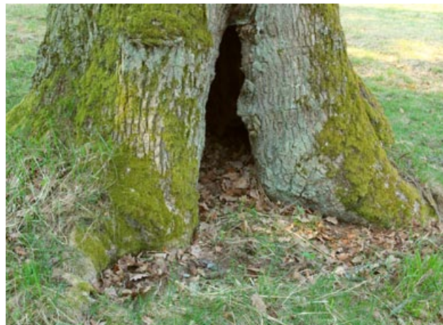
Obr. 5. Lánská obora, dutina v kmenu dubu. Fig. 5. Lány wildlife reserve, cavity in the trunk of oak.