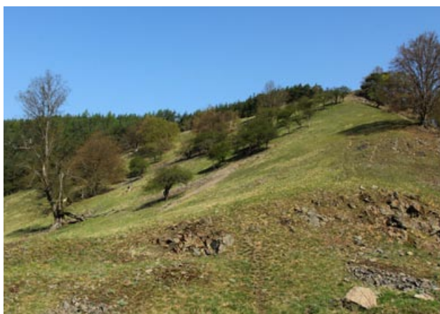
Obr. 3. Lánská obora, xerothermní stráň. Fig. 3. Lány wildlife reserve, xerothermic slope.

Pro bezobratlé živočichy poprvé navrhl použití DMHF STEEDMAN (1958) a po něm upravovali metodiku s ohledem na specifika brouků různých čeledí např. ANGUS (1969), BAMEUL (1990) a další. Oproti řadě dalších umělých pryskyřic má DMHF výhodu v tom, že vkládané objekty není nutno převádět přes lihové a xylenové řady nebo používat speciální rozpouštědla (izopropanol, xylen apod.). Před umístěním malých aedeagů do DMHF není nutné ani jejich poprání ve vodě (i glycerin je kompatibilní s DMHF, viz BAMEUL 1990). Při případných dalších manipulacích také později oceníme, že DMHF je zpětně kdykoli bezzbytku rozpustný vodou. Přesto řada sběratelů stále využívá k uložení aedeagu levnější, avšak složitější či časově zdlouhavější způsoby, např. za použití chloralhydrátu, euparalu, solakrylu či kanadského balzámu, případně různé trubičky s glycerinem připichované pod štítek s broukem atd. Tyto odlišné způsoby mají opodstatnění spíše při ukládání genitálií samičích.