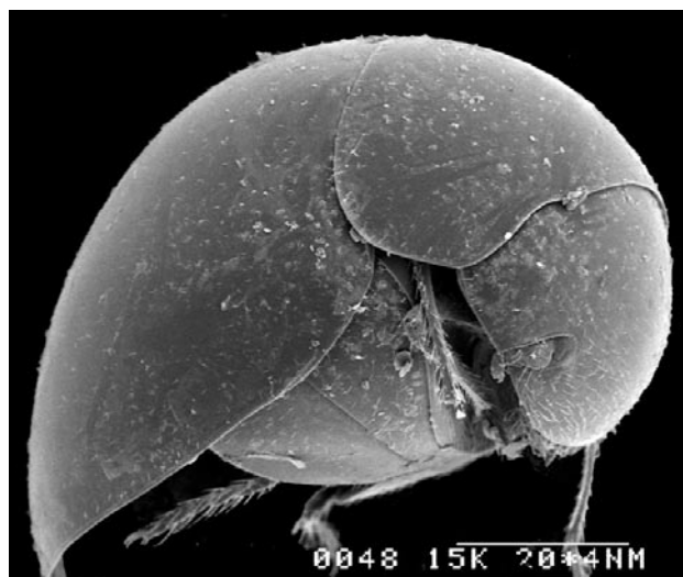
Obr. 1. Clambus sp. (převzato z POLILOV 2011).

požírající hlenky (Myxomycetes) a výtrusy vřeckovýtrusých hub (Ascomycetes) (MAJKA & LANGOR 2009). Brouci se dají nalézt v rozkládajícím se rostlinném materiálu (MAJKA & LANGOR 2009), v mokřem listí, v dutinách stromů a na okrajích kompostů. Některé druhy létají po soumraku v lesích nad povrchem půdy a dají se chytat do letových pastí (MAJKA & LANGOR 2009). Některé druhy jsou zřejmě myrmekofilní (HANGAY & ZBOROWSKI 2010). Imaga některých australských druhů byla nalezena i na květech (HANGAY & ZBOROWSKI 2010). Nejhojnější výskyt byl