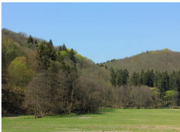
Obr. 4. Lánská obora, niva Klíčavy. Fig. 4. Lány wildlife reserve, floodplain of the Klíčava stream.